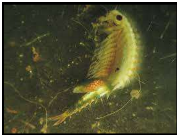
Slika 3: Rakec škrgonožec ( Chirocephalus croaticus )

Leta 1999 so na območju jezer Zgornje Pivke potekale obširne in sistematične raziskave. Raziskovalci so našli kar 181 rastlinskih vrst, poleg tega pa še 205 hroščev, 88 vrst metuljev in 16 vrst ptičev. V jezerih oziroma lužah so našli 13 vrst vodnih živali, predvsem žuželk in drobnih rakcev. Največjo pozornost zasluži 12–15 mm dolg rakec škrgonožec iz Petelinjskega jezera. Petelinjsko jezero je sedaj edini kraj na svetu, kjer še lahko najdemo te majhne, a zanimive rakce.