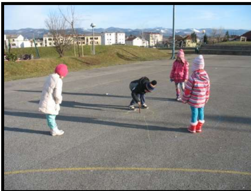
Slika 16: Zemljo krast

S palico narišemo krog – Zemljo in ga enakomerno razdelimo na toliko delov, kot je igralcev. V središče kroga narišemo še manjši krog – Sonce, ki služi za določanje smeri, kjer pade palica. Vsak izmed igralcev si za svoj kos zemlje izbere ime kakšne države. Potrebujemo še palico, ki jo za začetek igre postavimo v manjši krog – Sonce in ko ta pade ter pokaže na eno izmed držav, je to znak za začetek. Lastnik države pobere palico in zakliče, da napoveduje vojno eni izmed držav ter vrže palico v polje države, ki jo je izbral. Drugi se razbežijo takoj, ko palica pade, lastnik napadene države pa stopi nanjo in zakliče: »Stoj!« Vsi igralci morajo obstati, on pa skuša z mehko žogico zadeti katerega izmed soigralcev. Če mu to uspe, si lahko za nagrado vzame toliko zemlje, kolikor jo lahko doseže izza meje svoje države, vendar pa se ne sme dotakniti tujega ozemlja. Če je zgrešil, ima pravico do kraje ali zasedbe zemlje tisti, ki ga je ciljaj in ta mu lahko na enak način odvzame kos države. To je potem njegova lastnina in njegove meje se spremenijo za pridobljeni kos. Igralci se nato vrnejo na svoja polja oziroma države in spet mečejo palico. Če kdo izgubi vso zemljo, mora iz igre. Zmaga tisti, ki si nagradi vso ali največ zemlje.