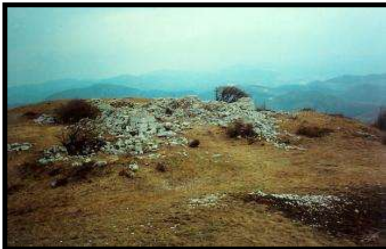
Slika 5: Ruševine cerkve na vrhu Sv. Trojice

sveče. Govori se, da se je tega dela naveličal, zato so sklenili cerkev uničiti. Poskusili so razdreti streho iz lesenih skodel, a ker je niso mogli razkopati, so jo po nasvetu domačega župnika zažgali. Cerkev naj bi pogorela okrog leta 1825. Domnevno sta ogenj podtaknila domačina, ki sta kasneje zgorela v požaru v stanovanjski hiši v Kleniku, župnik pa je bil premeščen v Istro in je tam znorel. Oltar iz cerkve so prepeljali v cerkev v Slavini, del kamnja pa so porabili za gradnjo nove trnjske cerkve.