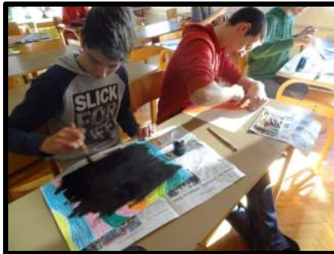
Slika 13: Priprava praskanke

Počakamo, da se posuši in nato s svinčnikom ali leseno paličico »izpraskamo« motiv.