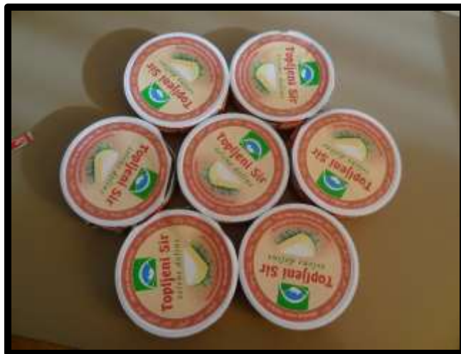
Slika 14: Iz škatlic sestavljena »roža«

Na ogrodje začnemo postavljati plasti papirja. Postopek ponovimo trikrat oz. štirikrat, tako, da dobim tri oz. štiri plasti in želeno obliko izdelka. Ogrodje pustimo na zraku, da se posuši.