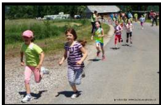
Slika 10: Petelinjski tek, 2015