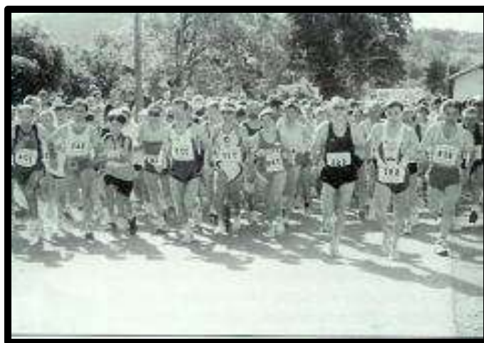
Slika 8 : Petelinjski tek, 2000

Sama prireditev pritegne v kraj do 2000 obiskovalcev. Med posebnostmi Petelinjskega teka je tudi brezplačni topli obrok za tekmovalce. Zadnjih 15 let moški pripravljajo pasulj, pridne gospodinje pa spečejo pecivo. V pripravih na tako množičen in zahteven dogodek sodeluje celotna vas.