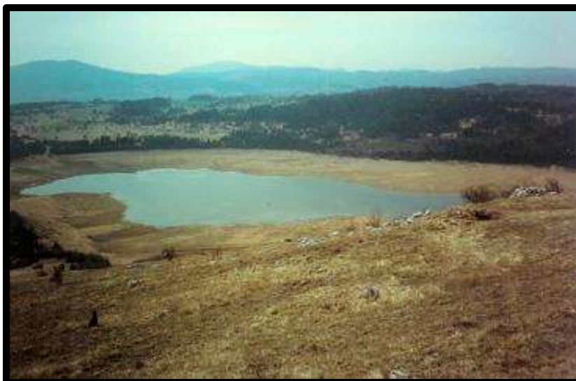
Slika 2: Petelinjsko jezero

Jezero je ob vsakem letnem času zanimivo in vredno ogleda.