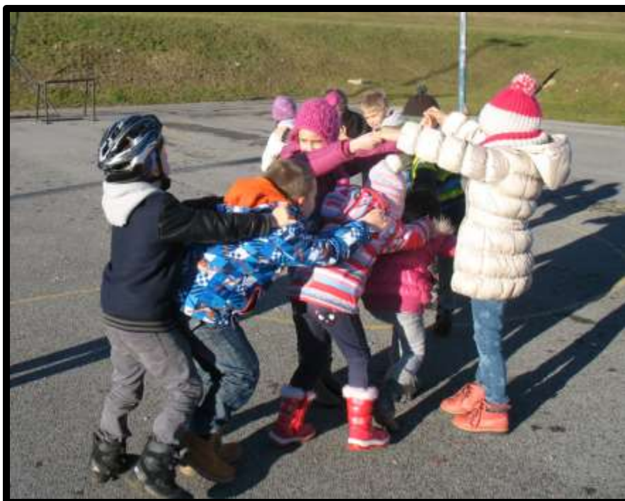
Slika 20: Ali je kaj trden vaš most

Most dvigne roke in kolona gre naprej pod rokami, pri zadnjem otroku pa most spusti roke in ga ujame. Most vpraša ujetega: »Kaj imaš rajši: jabolko ali kočijo?« Ujeti se odloči za en predmet in se postavi za tistega otroka – del mostu, ki predstavlja ta predmet. To se ponavlja, dokler ne ujameta zadnjega otroka oziroma lokomotive. Ko ga ujameta, ga rahlo potiskata levo in desno in štejeta dneve v tednu: ponedeljek, torek ... Lokomotiva pri tem poskuša pobegniti. Na koncu tudi lokomotiva izbere med dvema predmetoma in se pridruži ostalim, ki so se zvrstili v koloni na vsaki strani mostu. Trdno se primejo med seboj in začno vleči. Vsak del mostu s svojo ekipo vleče v svojo smer. Skupina, ki uspe obstati na nogah, je zmagovalka.