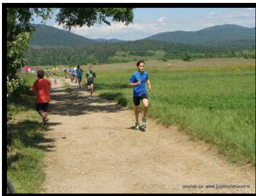
Slika 11: Petelinjski tek, 2015

Mladi tekmovalci v kategorijah predšolske in šolske mladine, se bodo pomerili na krožni progi v vasi Petelinje. Del proge poteka po asfaltu, del pa po kolovozu.