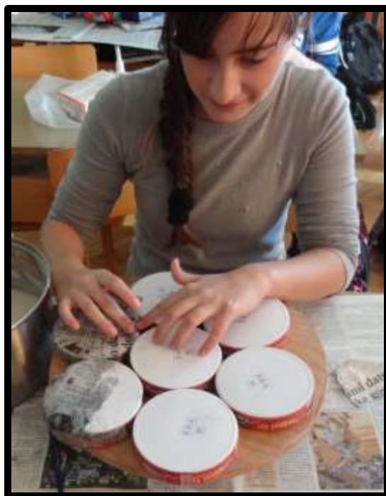
Slika 15: Kaširanje

Na ogrodje začnemo postavljati plasti papirja. Postopek ponovimo trikrat oz. štirikrat, tako, da dobim tri oz. štiri plasti in želeno obliko izdelka. Ogrodje pustimo na zraku, da se posuši.