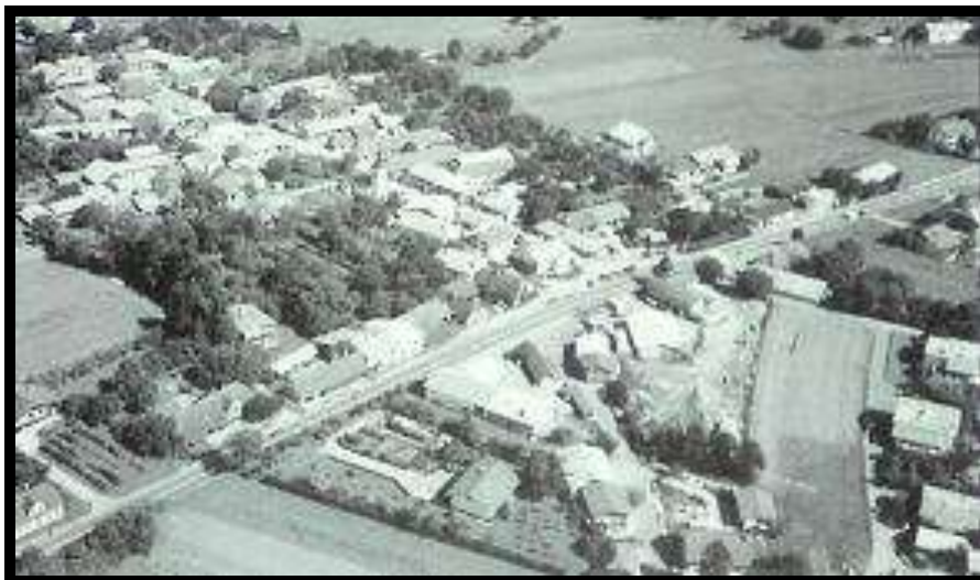
Slika 1: Petelinje

Vas pa se lahko ponaša še s Petelinjskim jezerom, ki se nahaja severovzhodno od vasi.