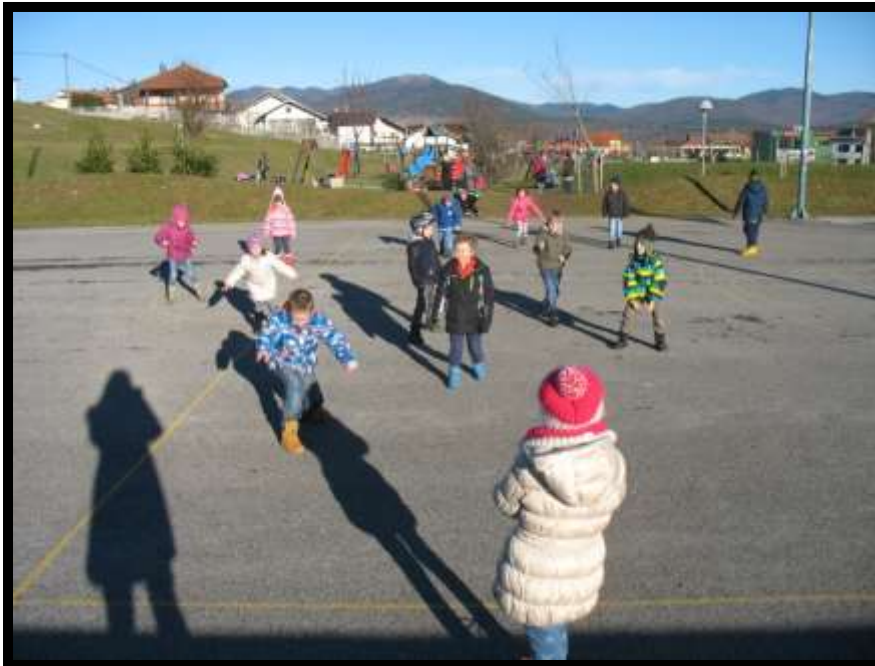
Slika 18: Siva cesta en, dva tri

Možne so priredbe z besedilom »Ljubljana, Zagreb, Beograd« ali drugim podobnim besedilom.