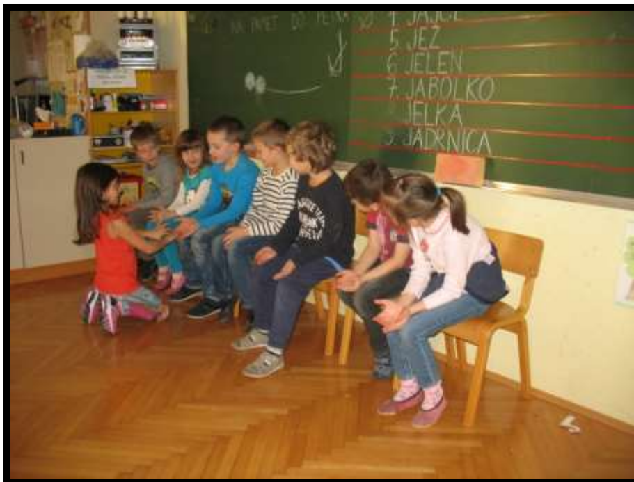
Slika 17: Klavirčki

Prodajalec določi klavirčkom melodijo (pesem), nato pa pride kupec, ki jih preizkuša, in izbere tistega, ki ima najlepšo melodijo (je najlepše zapel). Pri »preizkušanju« ima »klavirček« iztegnjene prste (dlani kažejo navzgor), kupec pa jih preizkuša s pritiskanjem na prste – tipke. Klavirček, ki je bil izbran za najlepšo melodijo, mora bežati pred kupcem in se vrniti nazaj v trgovino. Ujeti klavirček postane kupec, če pa se vrne na svoje mesto, kupec ostane isti.