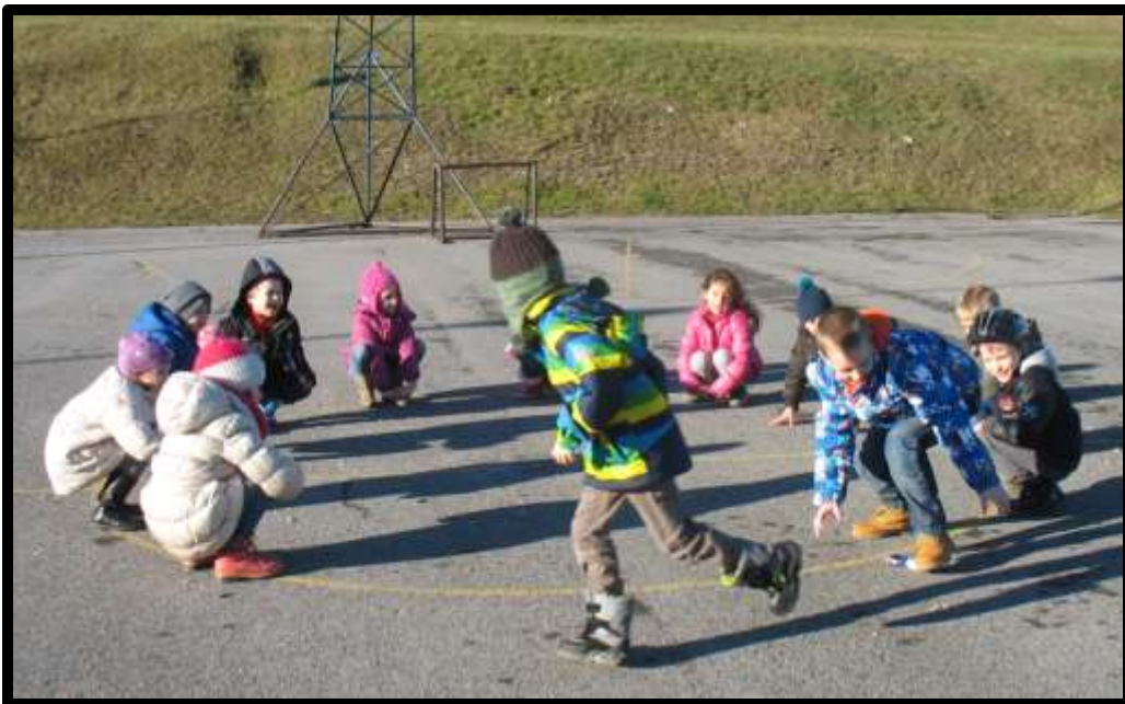
Slika 19: Gnilo jajce

Če je bežeči ujet, je on "gnilo jajce" in mora za kazen na sredo kroga. Na sredi kroga čepi, dokler ga ne zamenja drug igralec ali za čas enega kroga, sicer igro zunaj kroga nadaljuje igralec, ki mu je bilo podtaknjeno "jajce".