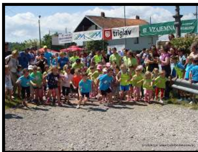
Slika 9: Petelinjski tek, 2015