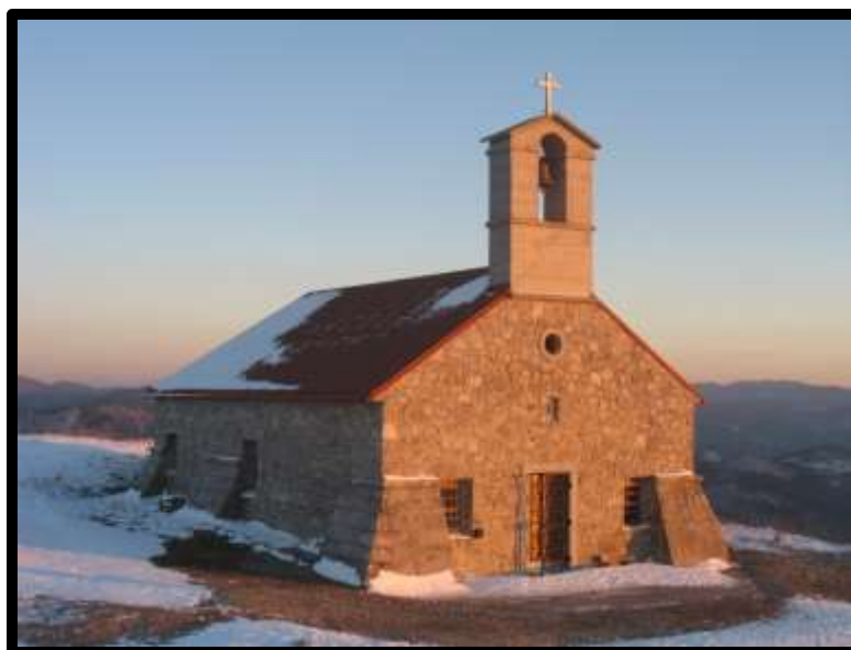
Slika 6: Obnovljena cerkev Sv. Trojice