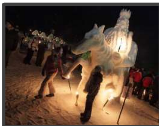
Kralj Matjaž sporoča