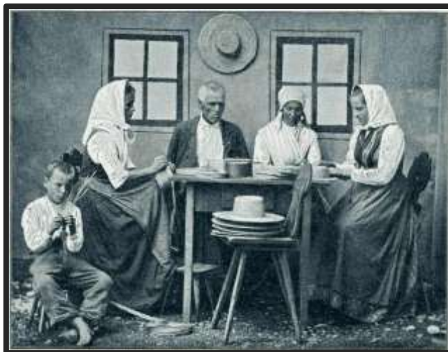
Ihanski slamnikarji leta 1903

Domača obrt je pojem, ki se je izoblikoval proti koncu 19. stoletja. Bila je znana kot postransko kmetovo delo. Največkrat je bila povezana z osnovno dejavnostjo kmetije ter je ponujala dodatno delo prebivalcem. V današnjem času pa je domača obrt bolj znana kot izdelovanje izdelkov, ki služijo za osebno porabo ali prodajo.