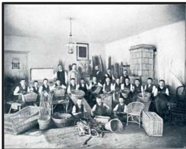
Pletarska šola v Radovljici leta 1908

Izobraževanje je bilo zelo pomembno za razvoj domače obrti pri nas. Njegovega pomena so se zavedali že v 18. stoletju, pravi razvoj pa je doživelo proti koncu 19. stoletja. Na področju čipkarstva je bil leta 1876 ustanovljen tečaj v Idriji, a je že kmalu zaradi protireklame, ki je odvrčala ljudi od tečaja, nehal delovati. Vendar je bila v Idriji še isto leto ustanovljena prva čipkarska šola, ki je bila sprejeta z velikim navdušenjem in kmalu so se šole razširile tudi po drugih mestih. Državno obrtno šolo v Ljubljani so ustanovili leta 1888. Sprva je bila razdeljena na dva dela: na šolo za lesno industrijo in šolo za umetno vezenje in šivanje čipk.