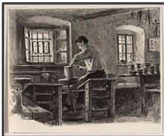
Charlemont: Kmet lončari ( Domača obrt na Kranjskem , 1891)